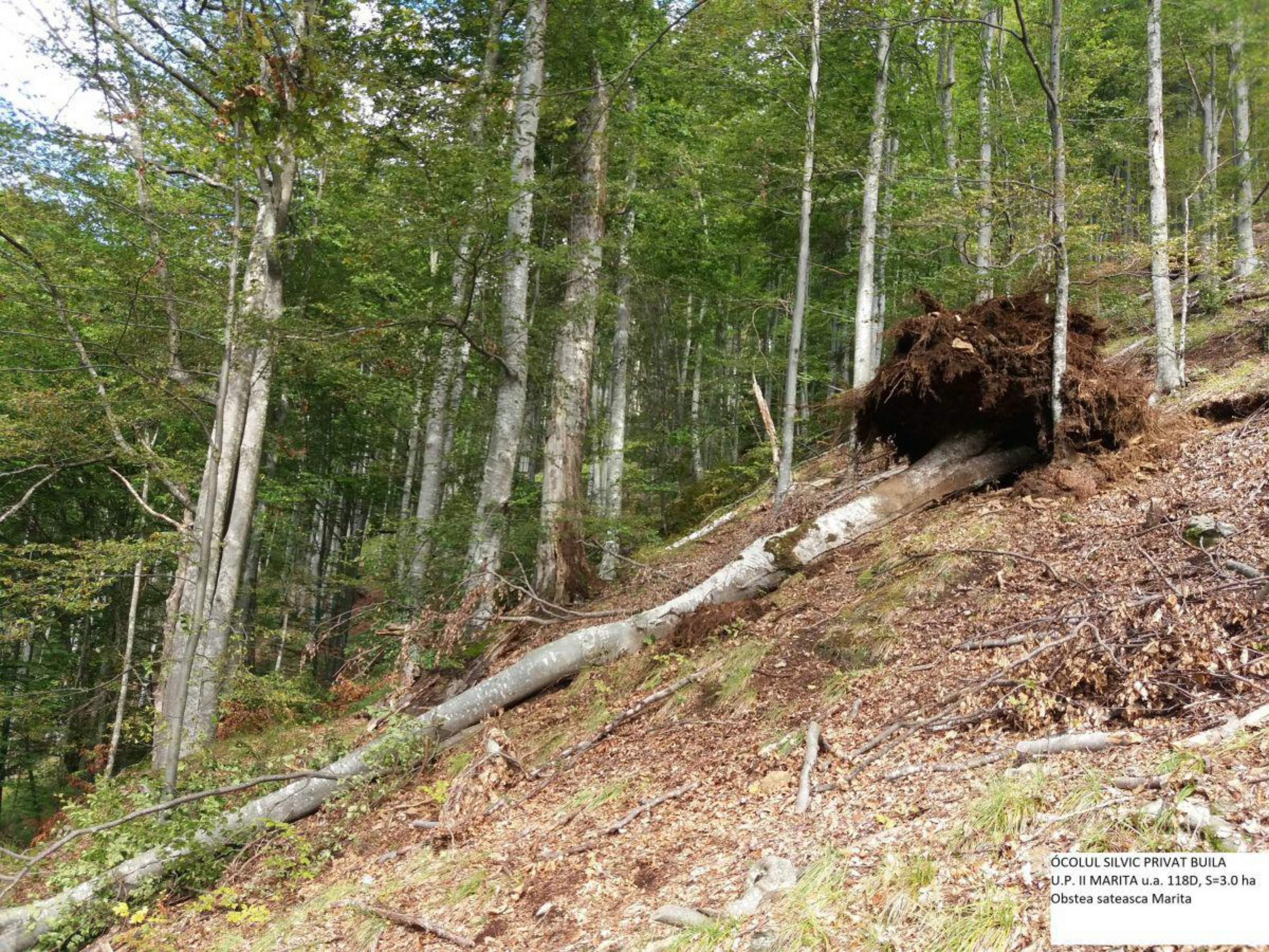
ÓCOLUL SILVIC PRIVAT BUILA U.P. II MARITA u.a. 118D, S=3.0 ha Obstea sateasca Marita