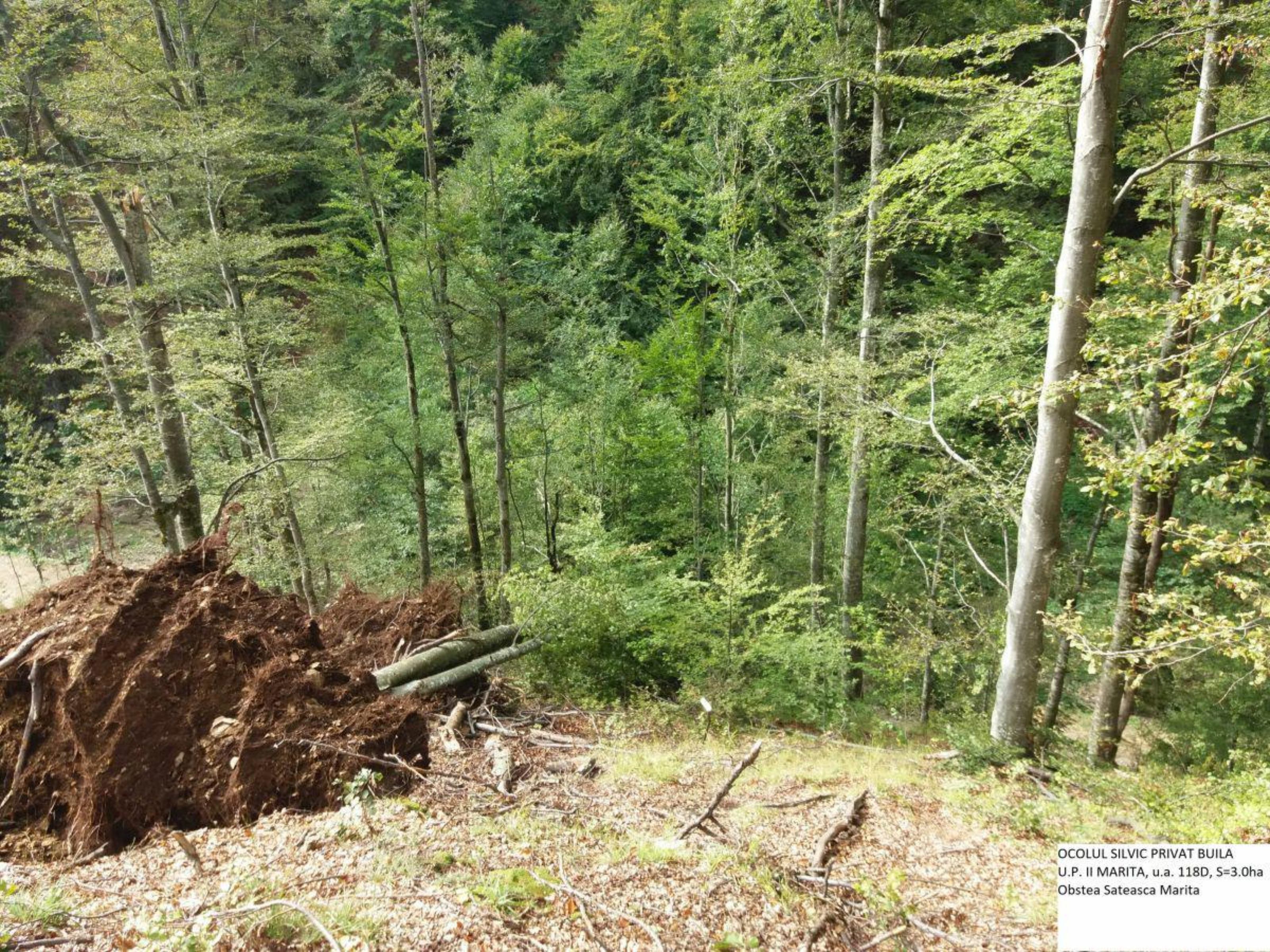
OCOLUL SILVIC PRIVAT BUILA U.P. II MARITA, u.a. 118D, S=3.0ha Obstea Sateasca Marita