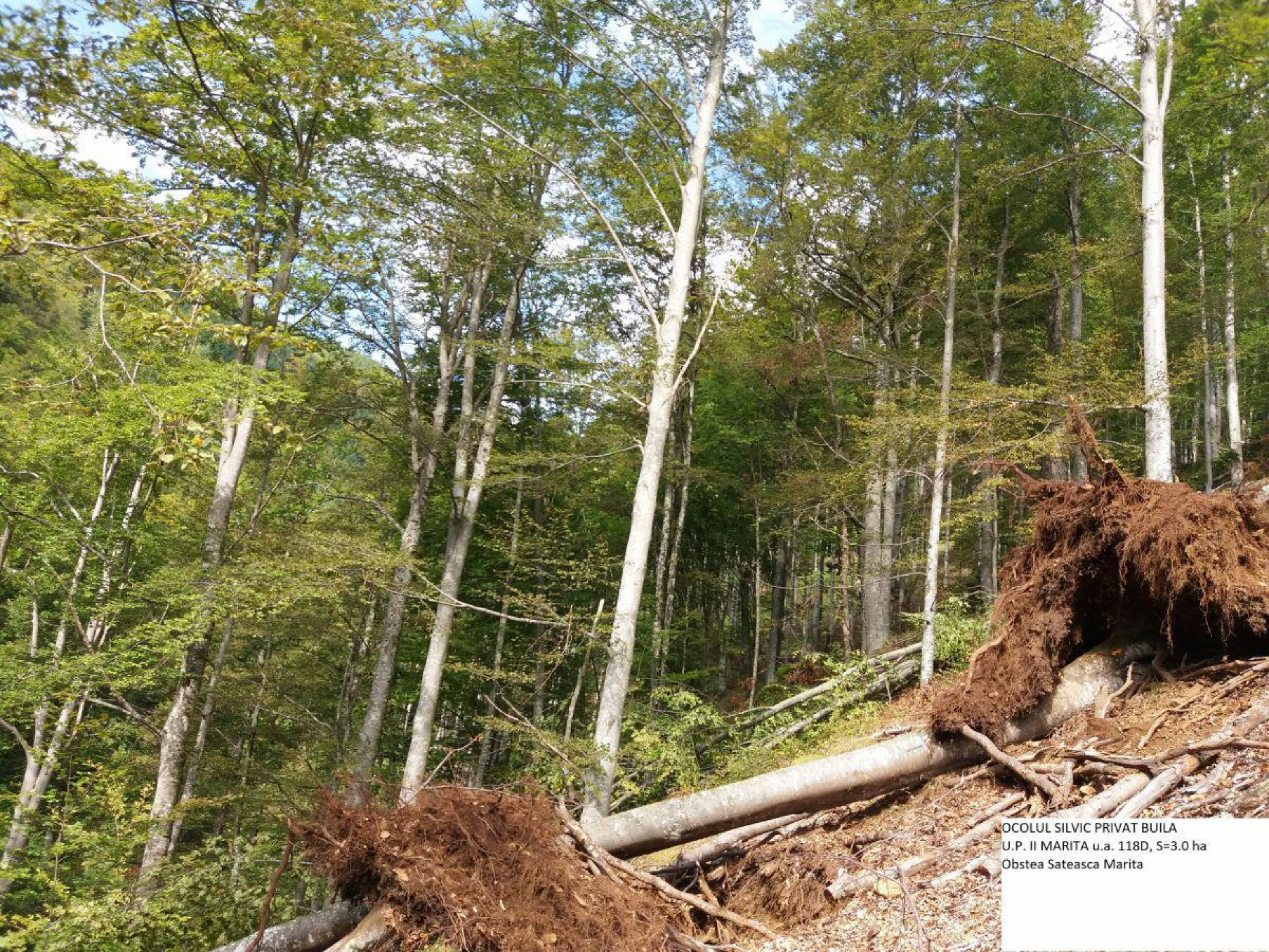
OCOLUL SILVIC PRIVAT BUILA U.P. II MARITA u.a. 118D, S=3.0 ha Obstea Sateasca Marita